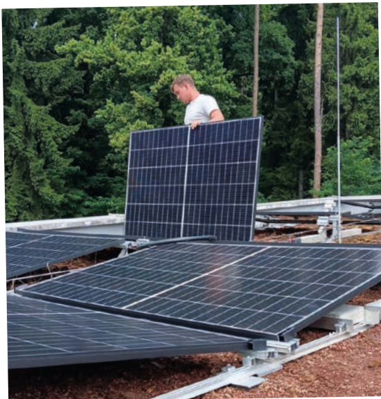
Neue Photovoltaik-Anlage am Kinderhilfe Haus Graz

Eine großzügige Spende in Form einer neuen Klimaanlage sorgt künftig für angenehme Temperaturen, damit sich Familien in schwierigen Zeiten rundum wohlfühlen können. Zusätzlich liefert eine moderne Photovoltaik-Anlage umweltfreundliche Energie und senkt die Betriebskosten nachhaltig. Der Umbau erfolgte im laufenden Betrieb.