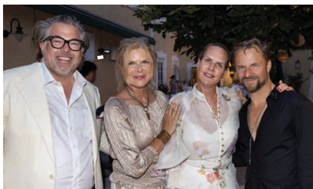
Philipp Hochmair begeisterte mit Schillers „Der Taucher“.