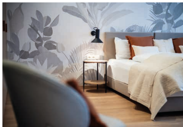
Behagliche Atmosphäre im Haus Wr. Neustadt

Kinder brauchen Sicherheit, Anregung und Platz zum Spielen. Wir gestalten kinderfreundliche Bereiche mit weichen Materialien, niedrigen Möbeln, sicheren Kanten und gut sichtbaren Spielzonen.