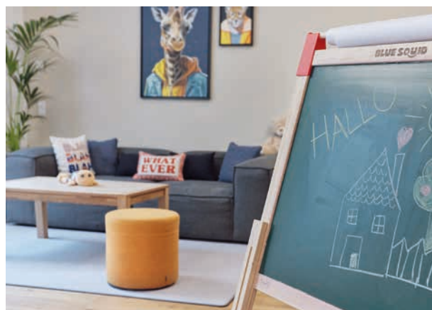
Spielzimmer im Haus Borschkegasse in Wien