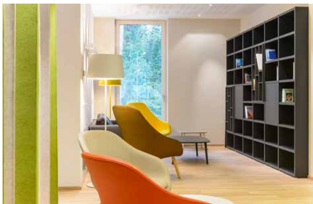
Die fröhlichen Farben der Lobby im Haus Graz

Farben beeinflussen unsere Stimmung. Deshalb setzen wir auf warme, freundliche Töne, die Ruhe und Lebensfreude ausstrahlen. Rückzugsbereiche haben beruhigende Farben, Gemeinschaftsräume lebendigere Akzente.