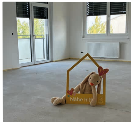
Das Kinderhilfe Haus Wr. Neustadt wird größer ...

Mehr Platz für Familien, mehr Raum für Nähe. Die Nachfrage ist groß, deshalb wächst das Kinderhilfe Haus in Wiener Neustadt. Bis Ende des Jahres wird die Fläche verdoppelt. Künftig stehen neun statt fünf Apartments bereit, ergänzt durch größere Gemeinschaftsbereiche, die Nähe und Geborgenheit schenken. Besonders einzigartig: Hier wohnen auch die kleinen Patient:innen selbst, so lange sie im MedAustron behandelt werden. Für sie und ihre Familien bedeutet das kurze Wege, weniger Belastung und die Gewissheit, in schwerer Zeit zusammen sein zu können.