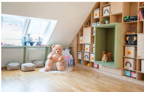
Auch für die Kleinen gibt es einen gemütlichen Spielbereich im Haus Kinderspitalgasse.

Unsere Gemeinschaftsräume laden zum Gespräch ein, lassen aber auch Rückzug zu. Es gibt offene Grundrisse mit verschiedenen Bereichen: Plätze für Austausch, Ecken zum Lesen, Räume für Kinder unterschiedlichen Alters.