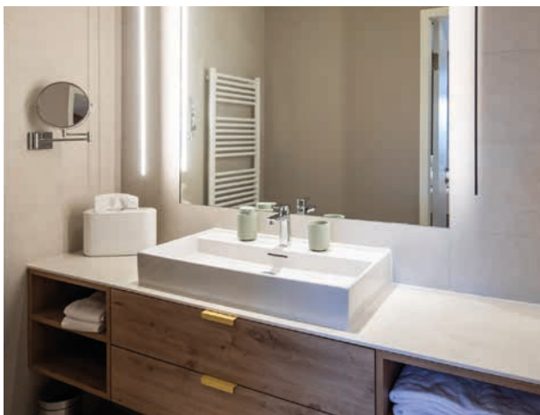
Badezimmer-Ausstattung im Haus Wr. Neustadt

Für die Kinderhilfe bringt LAUFEN diese Qualität noch näher: Mit großzügigen Sachspenden, preisgekröntem Interior-Design und persönlichen Einblicken in die Werkstatt macht LAUFEN Wohnlichkeit und Geborgenheit spürbar.