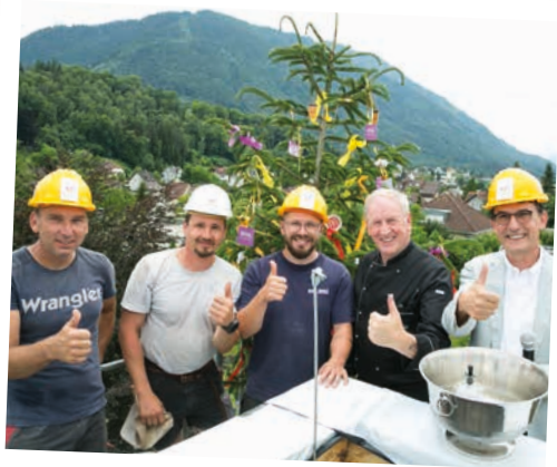
Firstfeier in Feldkirch